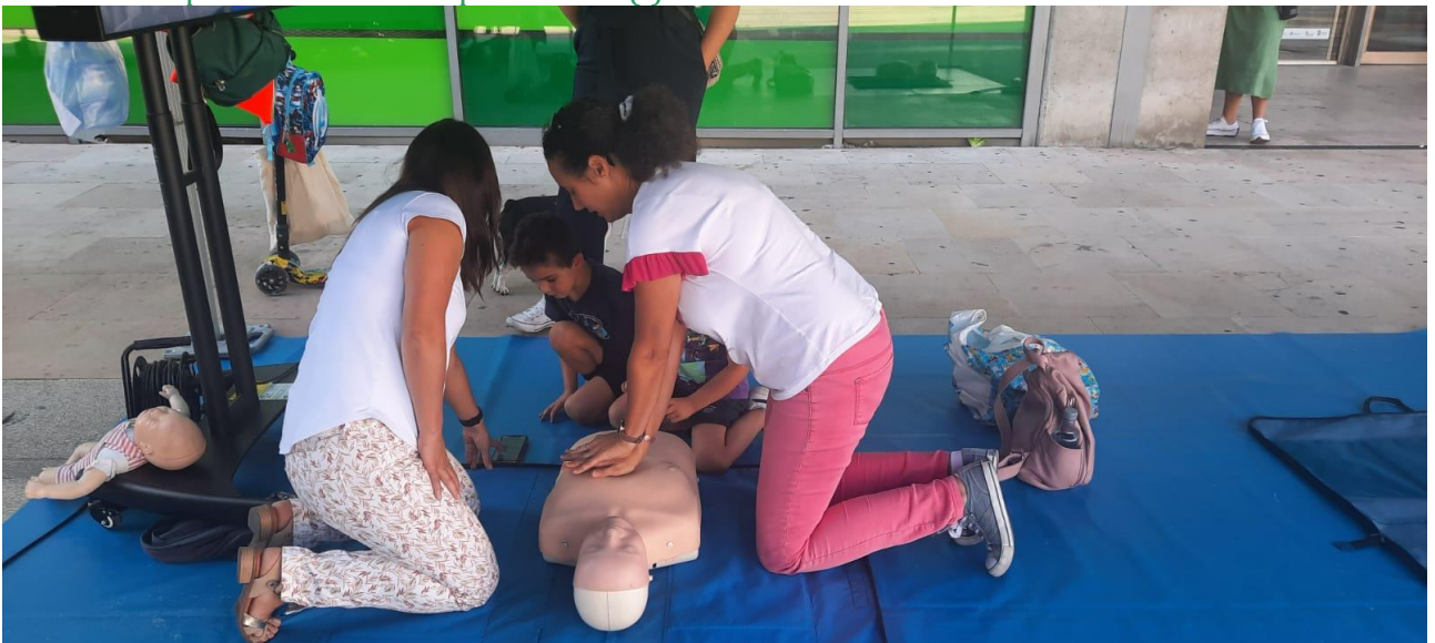
📍 Taller de primeros auxilios para niños (ii)