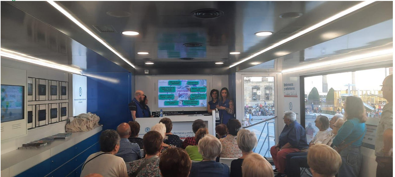
📍 Prevención e identificación de ICTUS (ii)