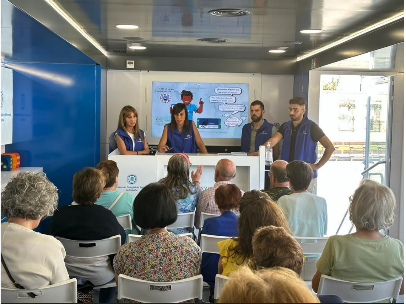
📍 Prevención e identificación de ICTUS (i)