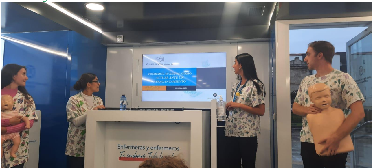
📍 Pediatría 📍