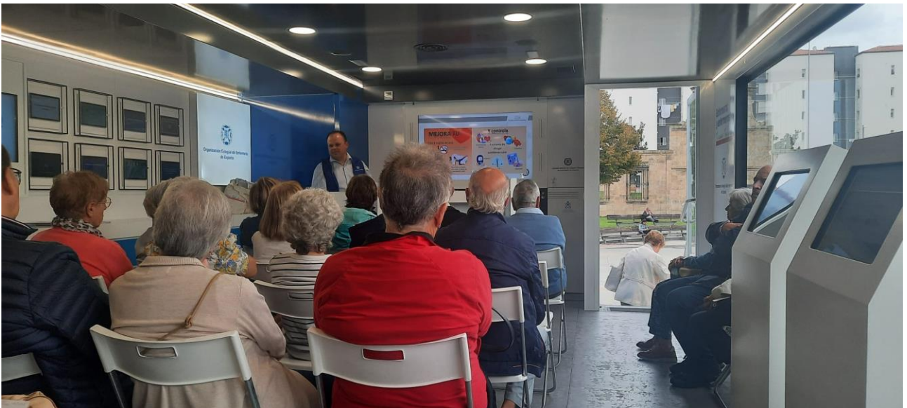
📍 Cuida tu corazón