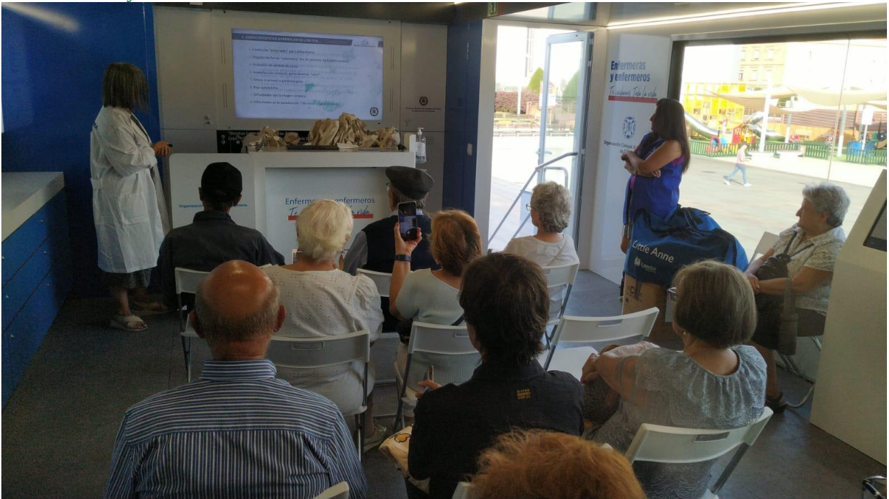
📍 Los trastornos de la conducta alimentaria: como identificarlos y prevenirlos