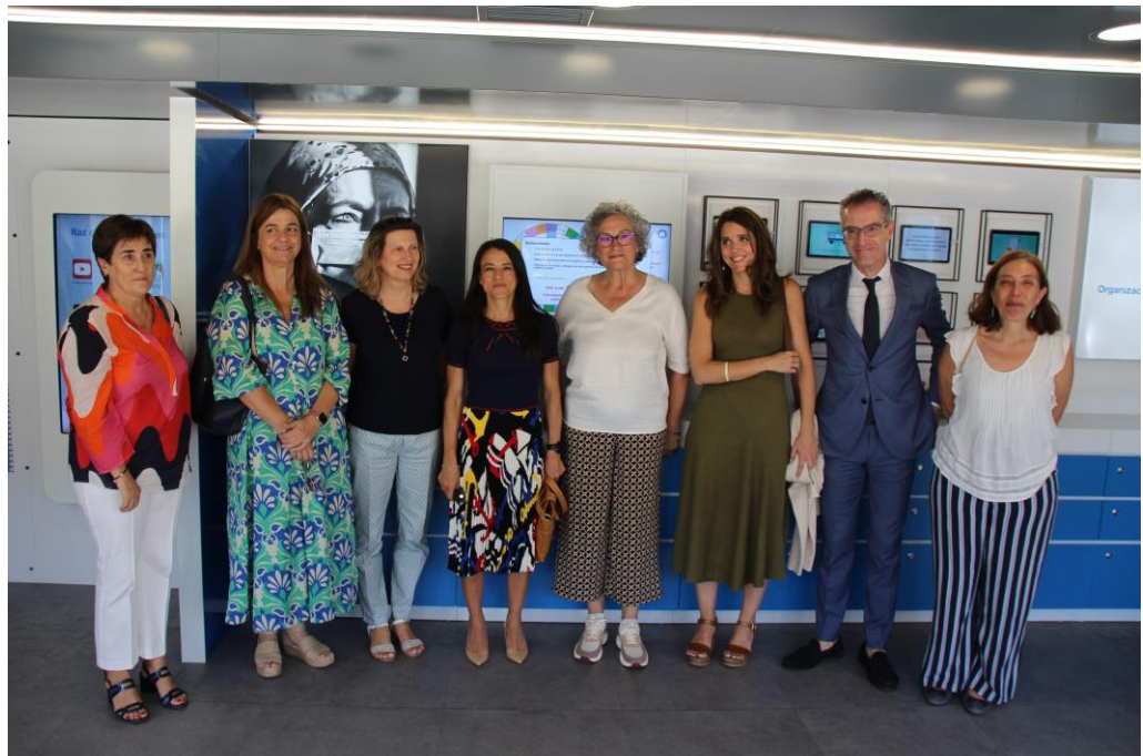
Imagen apertura del acto

En cuanto al autobús, además de otras propuestas como charlas o talleres, servirá para dar a conocer las prestaciones de la enfermería e incentivar en la sociedad hábitos saludables, una alimentación correcta o un seguimiento de la salud de quienes asistan”.