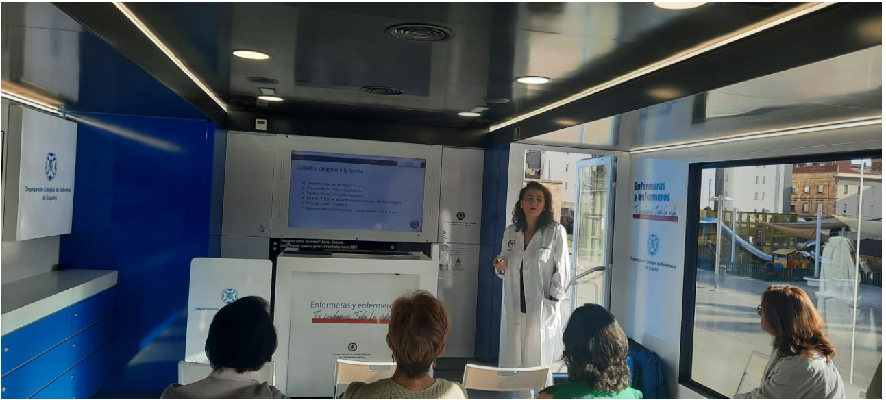
📍 Cuidados Paliativos