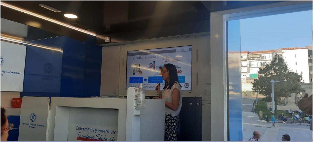
📍 ¿Cómo ser donante de médula ósea?