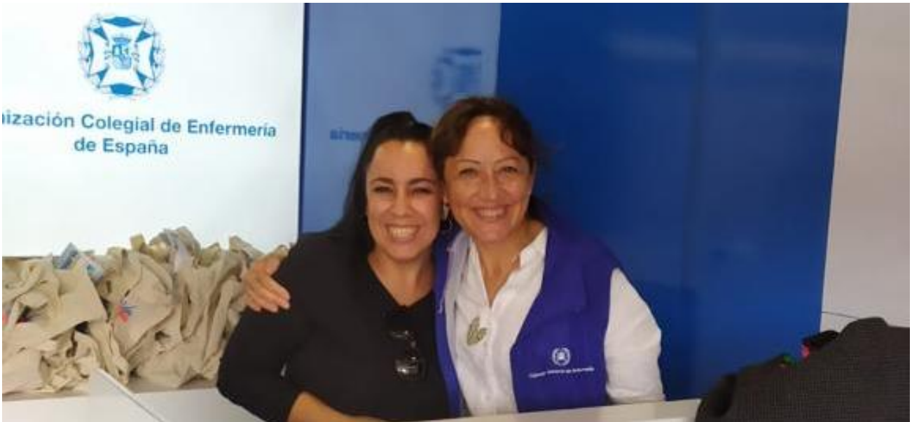
📍 Lactancia Materna