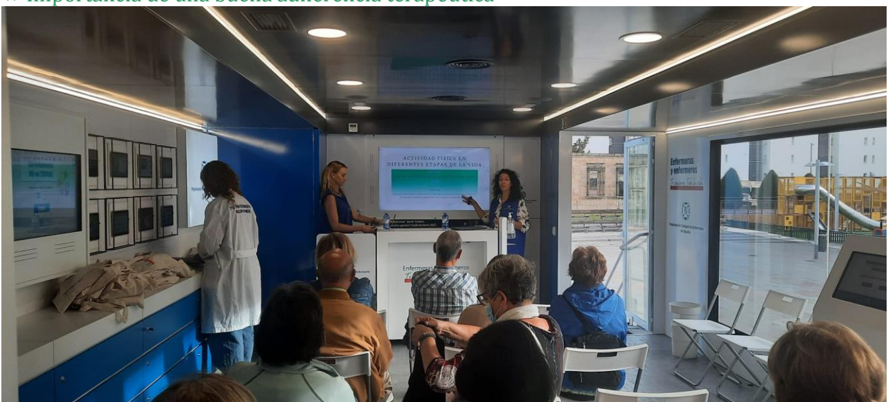
📍 Ejercicio físico en diferentes etapas de la vida