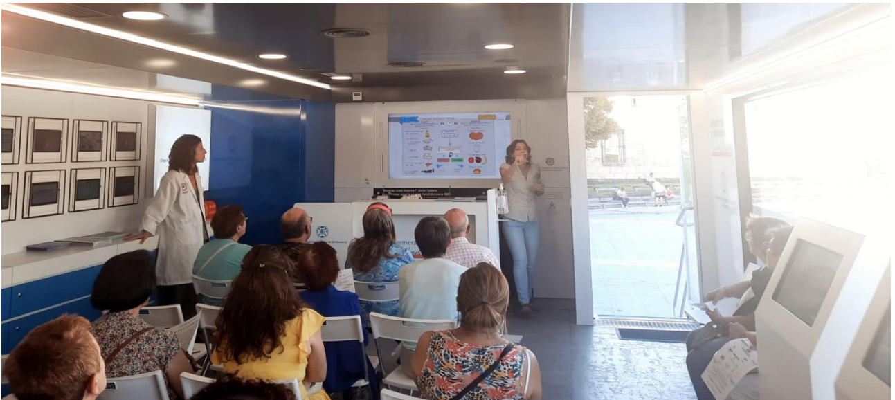
📍 Cuidados en diabetes