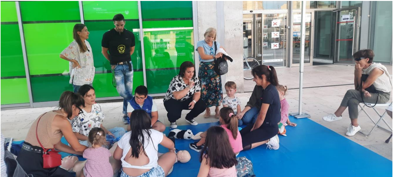
📍 Taller de primeros auxilios para niños (iii)