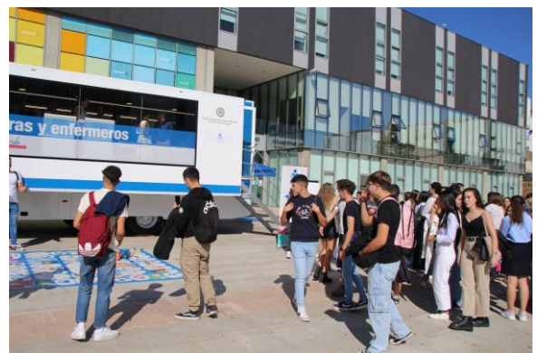
Asistentes al acto inaugural