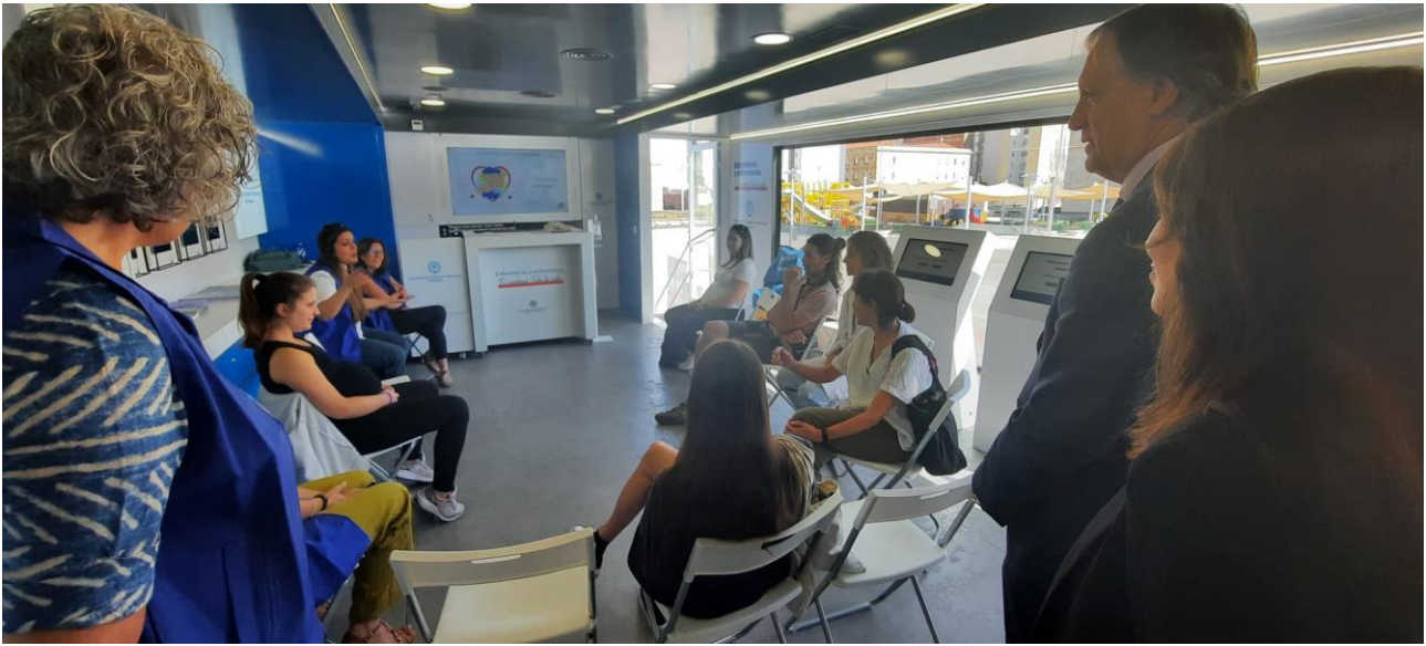
📍 Embarazo y Parto