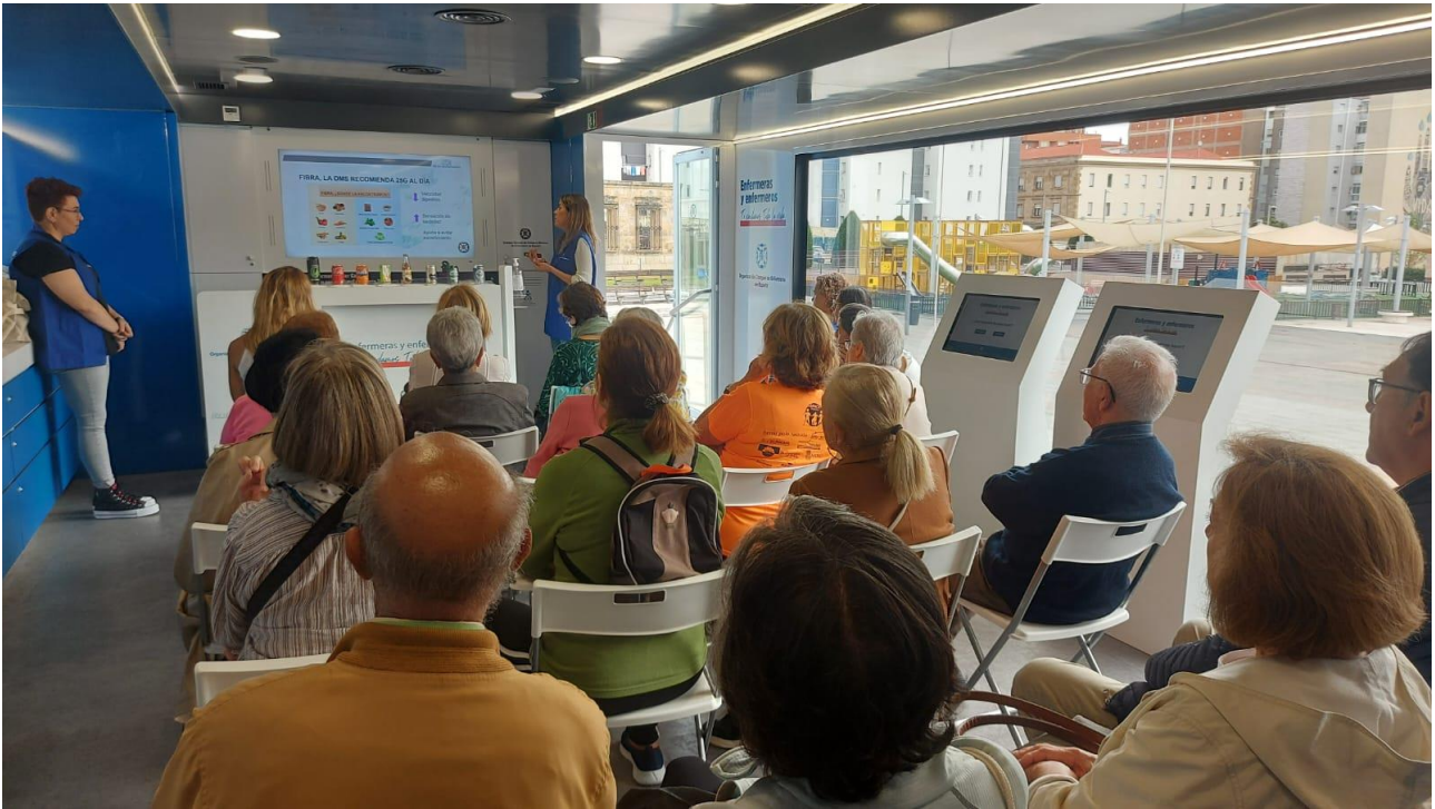
📍 Hábitos de Alimentación saludable