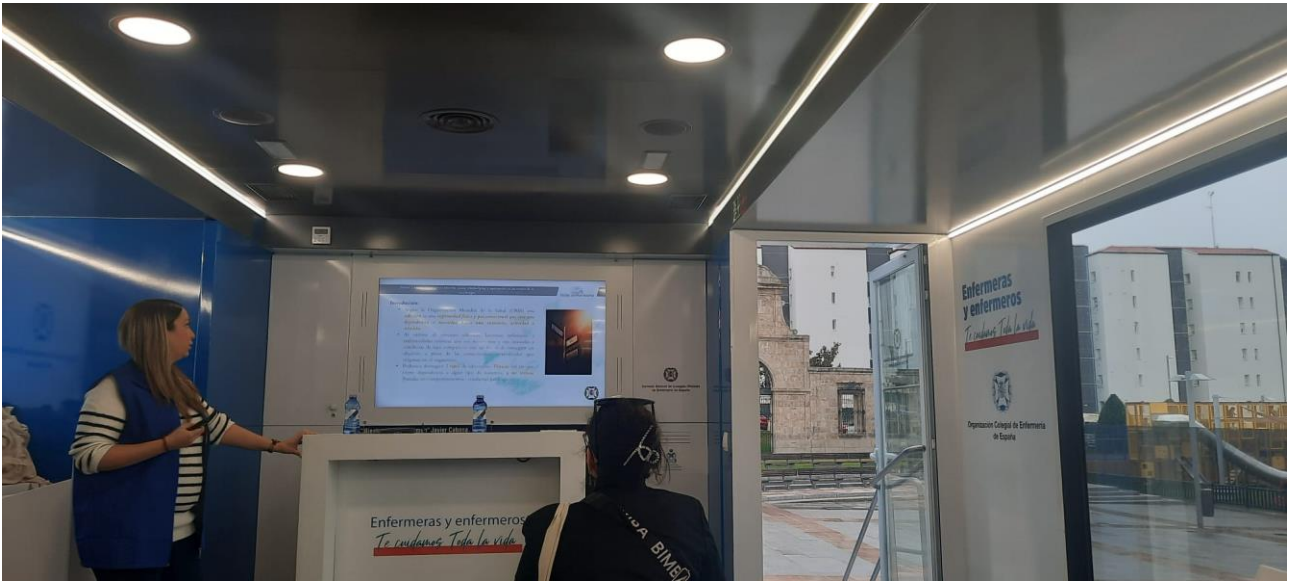
📍 Jóvenes y nuevas tecnologías, adicción acoso, cyberbullying y repercusión en trastornos de la autoimagen