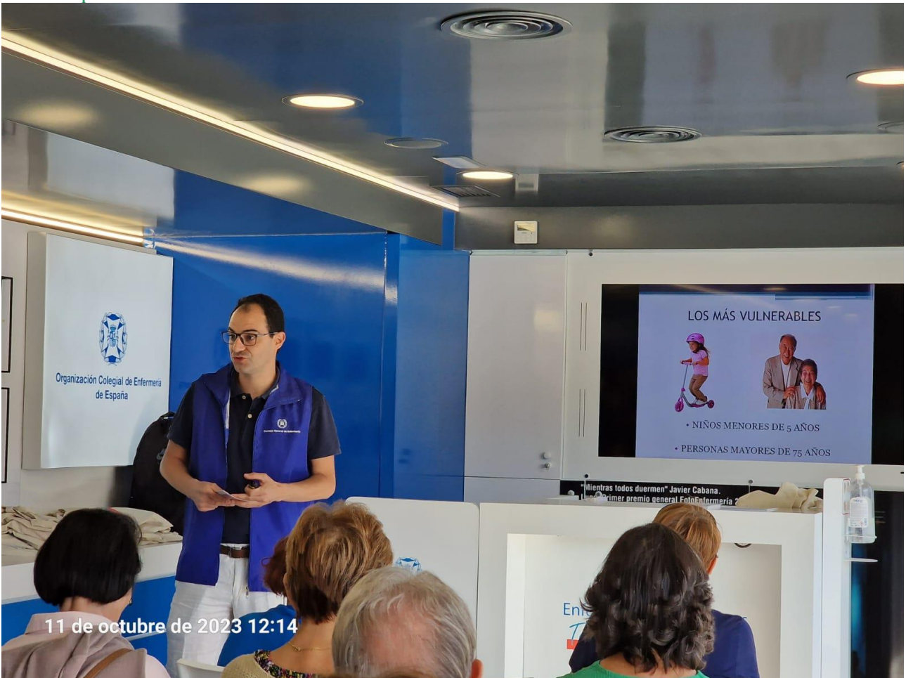
📍 La prevención no tiene edad