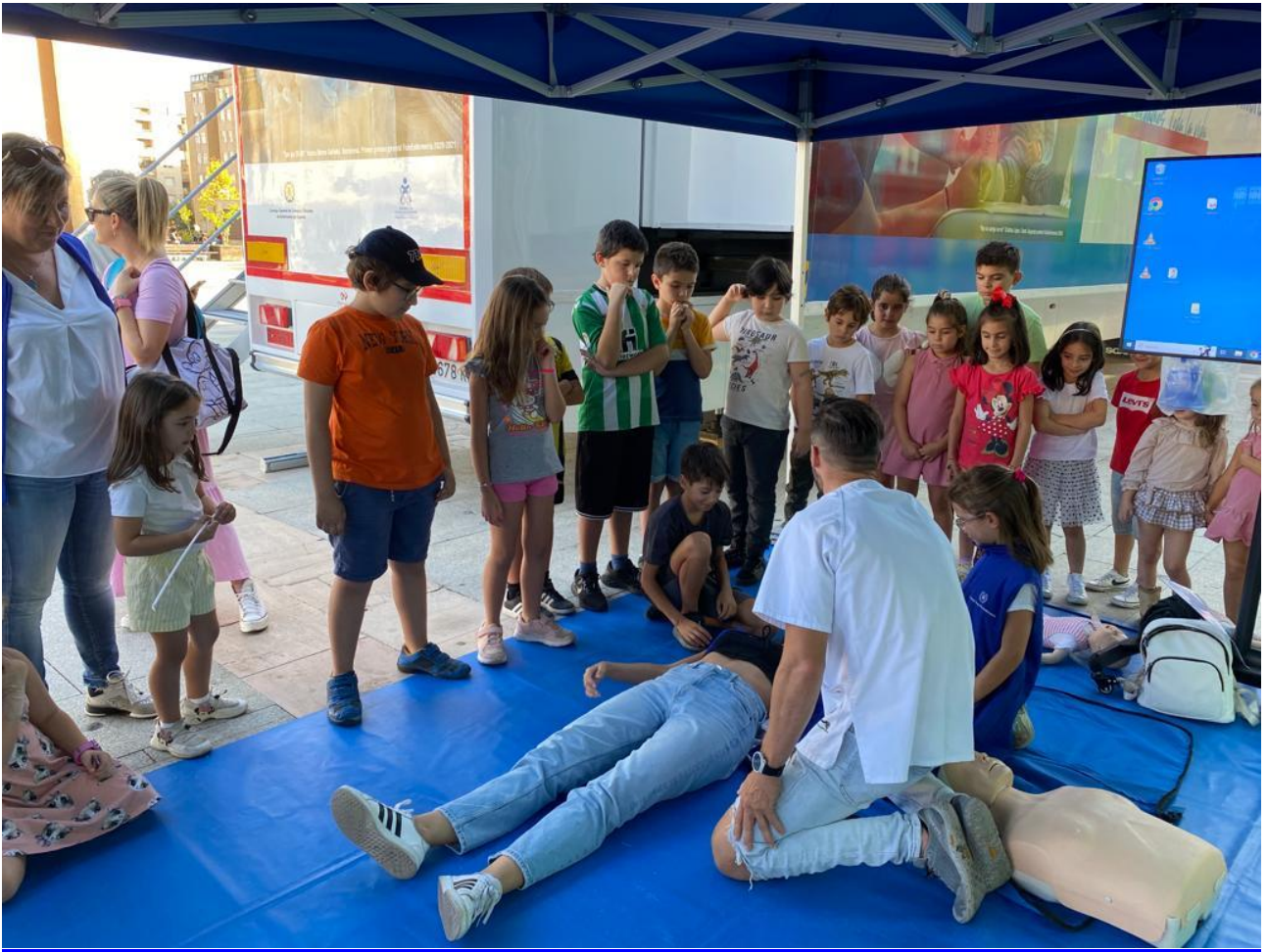
📍 Taller de primeros auxilios para niños (i)