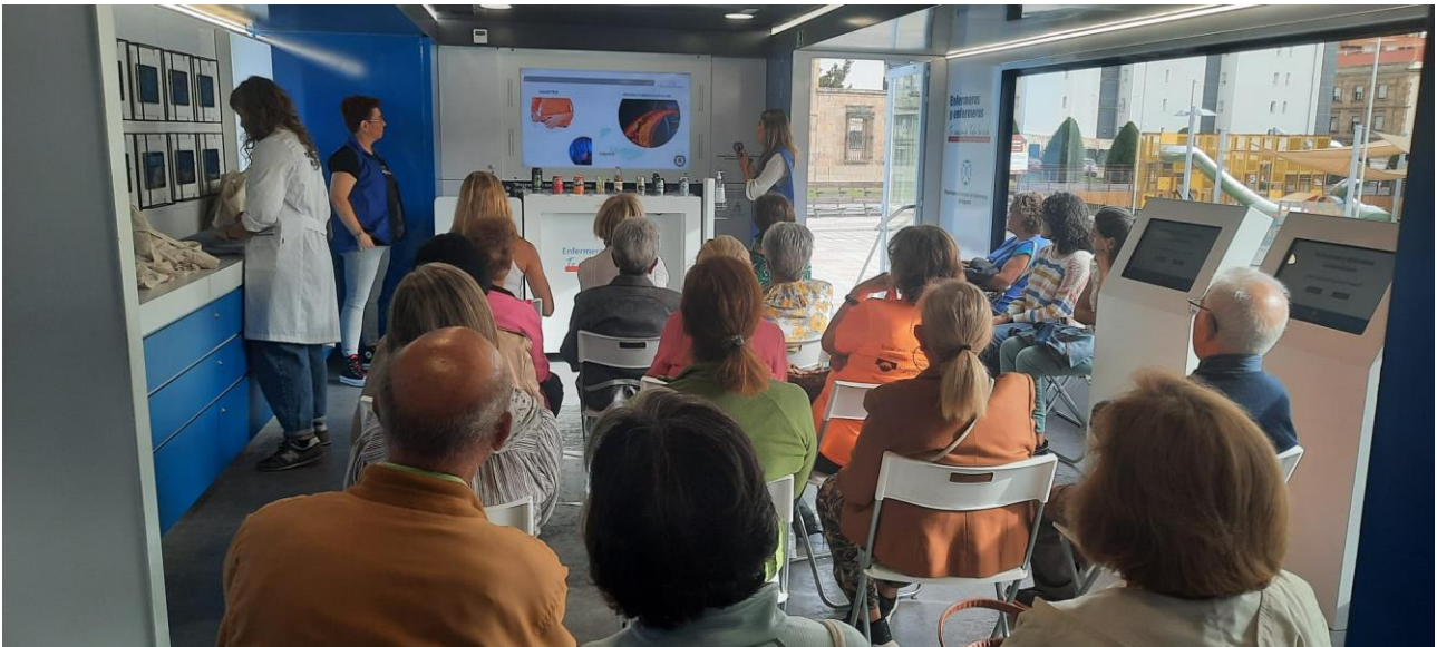
📍 Alimentación complementaria para bebés (BLW)