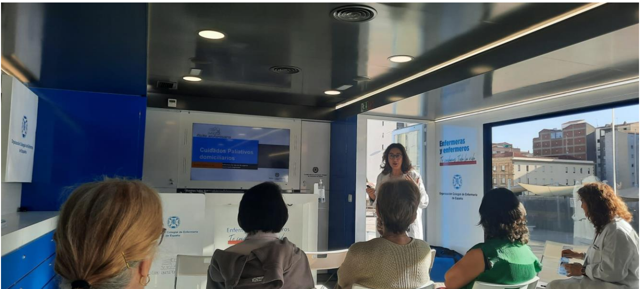
📍 Cuidados Paliativos

Ruta Enfermera Salamanca “ Te cuidamos toda la Vida”